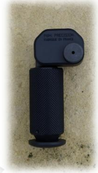
En exemple ci-dessus : un bipied TIER ONE