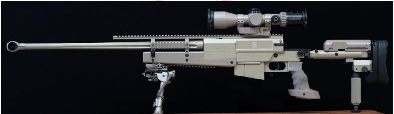
Exemple ci-dessus d'un fusil PGM 338 Lm (entièrement équipé)

(Le calibre est à choisir en fonction des distances auxquelles vous souhaitez tirer et aussi cela dépend des goûts et des couleurs de chacun.